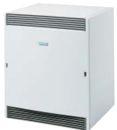
HiPath 1190: Sua modularidade garante um sistema ideal para o seu negócio, atendendo a todas as suas necessidades de comunicação.

Criam alternativas através dos módulos de expansão Key Module, que disponibiliza 16 teclas de expansão com LED, aumentando as informações memorizadas no telefone. Solução de audioconferência com o Microfone e Auto falante externos.