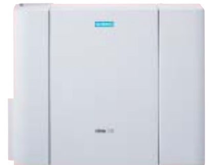
HiPath 1150: Disponibiliza uma grande variedade de facilidades para assessorar a sua empresa, minimizando custos e otimizando os processos do seu negócio.

de Call Center que permite ao supervisor receber e monitorar todas as informações sobre o atendimento. Evitando a perda de ligações, você ganha a fidelidade de seus clientes, além de otimizar os recursos necessários para o atendimento. O sistema informa os dados dos agentes, chamadas recebidas, fila de espera, estatísticas de atendimento por grupo e por agente, entre outras informações que auxiliam no gerenciamento do Call Center.