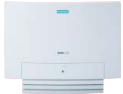
HiPath 1120: Equipamento ideal para pequenos escritórios e residências.